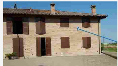
Appartamenti Via Solimei n.153/B - 151875